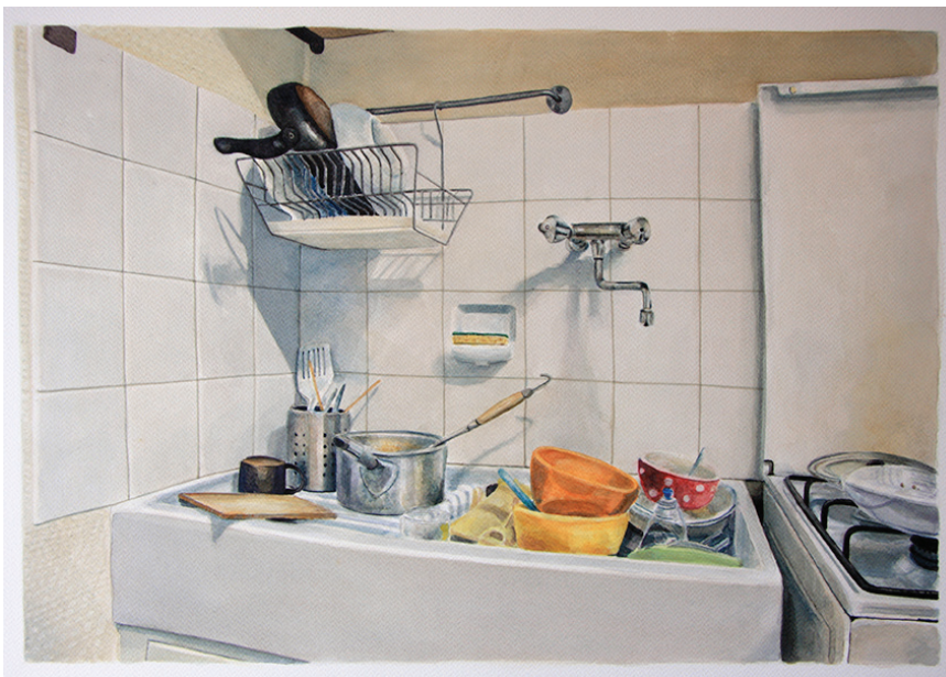
Évier , 2014, Aquarelle. Sink , 2014, watercolours.

A white shape, Trench Warfare, which pattern reminds us of the piled sandbags from the First World War trenches, is used as a skate ramp. Briac plays with the ability these riders have to use their environment as a playground. With perfect technique, Briac Leprêtre interprets still life style and offers us watercolour paintings depicting a sink full of dishes or a bathroom as well as numerous small size pictures of bakeries or vegetables over a white background.