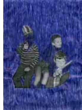
sans titre - 2010