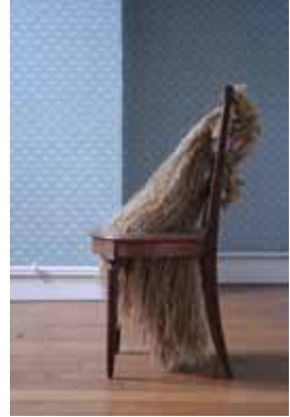
La Ruse symétrique, 2008

Chaise, ficelle 40 x 45 x 90 cm Adieu Berthe, Lab-Labanque, Béthune