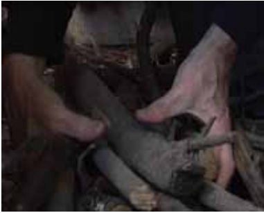
Repentirs 2009 vidéo, 8'56", couleur, muet.