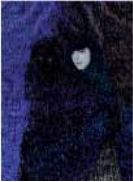
sans titre - 2012