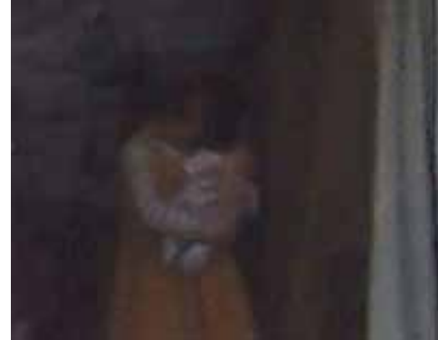
Petite fille à la fenêtre