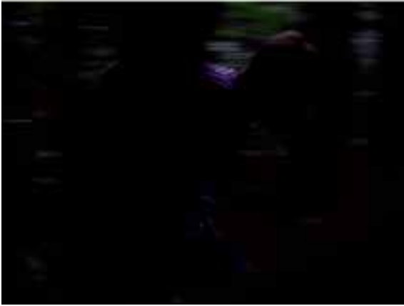
La Forêt - 2010