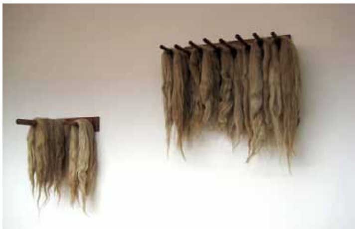
Mauvaises graines , 2010 Bois, chanvre