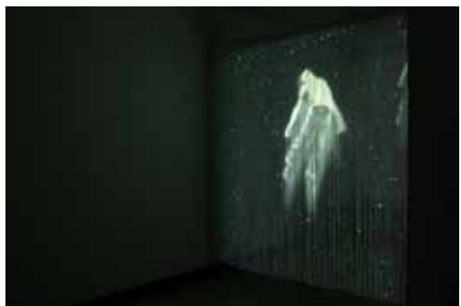
THE UNCERTAINTY OF STARS 2007 Installation vidéo Ecran de fil 240x250cm, projection 8mn en boucle