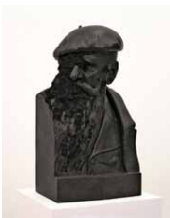
Excitation coercitive 2011 Buste en bronze, aimants et poudre d'aimants