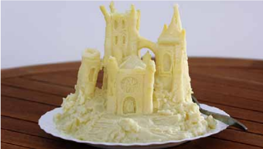
En attendant que ça refroidisse ? 2006 purée, assiette, fourchette