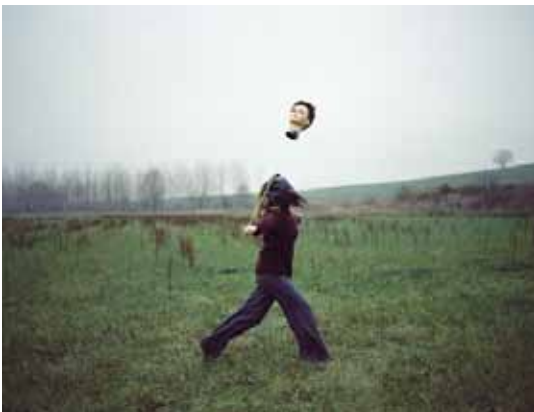
19h51, 2005 (ballon tête)