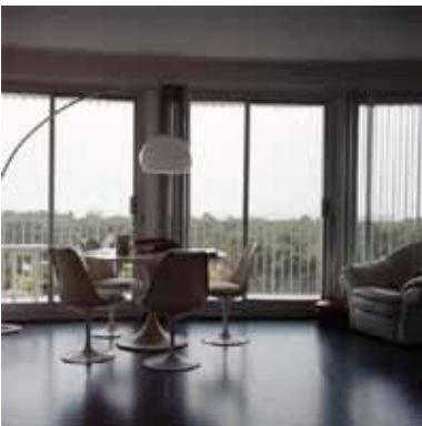
Réflexion 2008 photographie argentique, 120 X 120 cm extrait de la série Intérieur