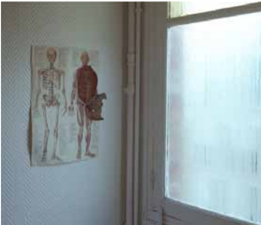
Le squelette 2010