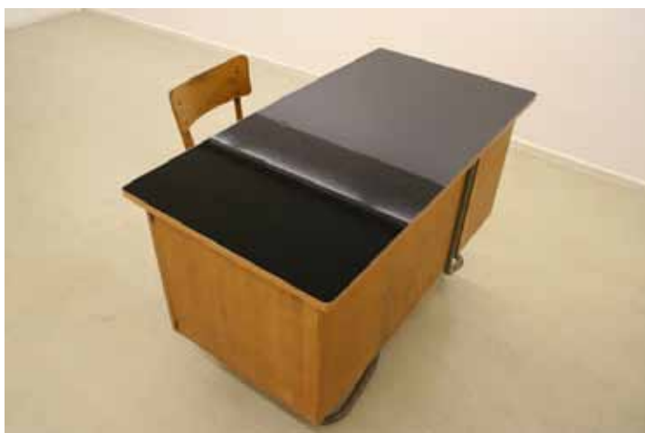
Décharge , 2005 Bureau, chaise, encre de Chine 125 x 65 x 75 cm L'espace de l'objet, Le Crédac, Ivry-sur-Seine