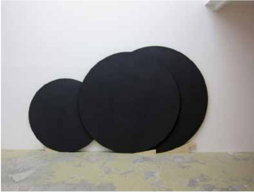
La lune, le paon et ce qui suit 2011 sculpture dimension variable medium noir teinté dans la masse, cale en pin