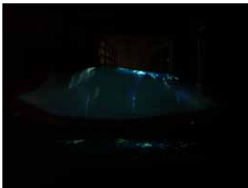
LE MONDE SUSPENDU 2011 Installation vidéo