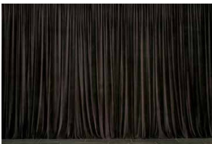
Rideau , 2007 Velours, acier, plâtre 600 x 400 cm Wheel, Printemps de Septembre, Musée des Abattoirs, Toulouse