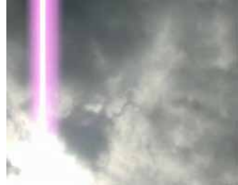
un jour... tu sais... 2009 05'08 - projection vidéo