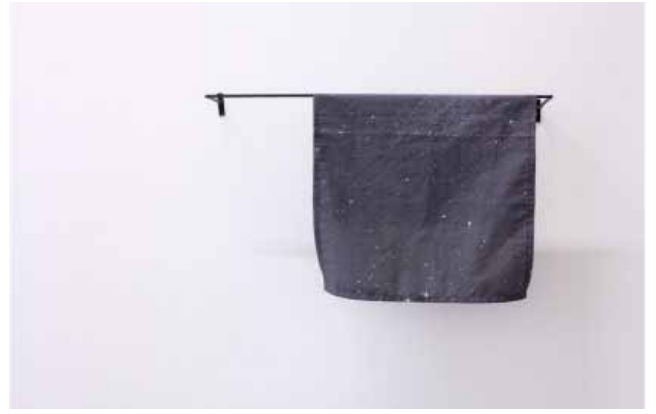
sans titre - 2012