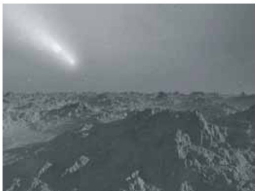
SANS SOLEILS 2008 Épreuves jet d'encre sur papier argent 20x26cm - exemplaires uniques