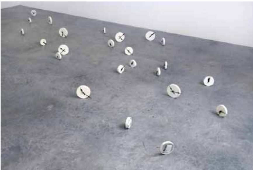
Débattre la mesure 2007 horloge p.v.c., fils, piles, colle, peinture