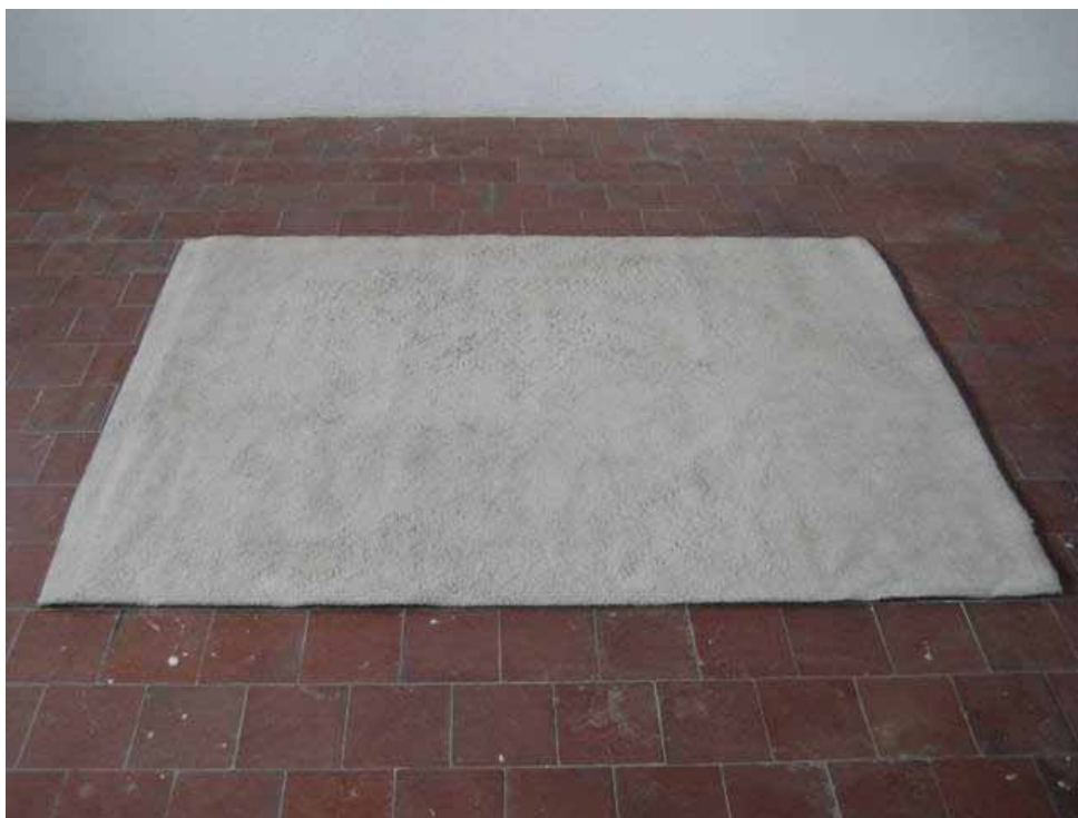
Tapis, 2012., 125 x 175 cm, tapis, cendre Production MPVite, Nantes