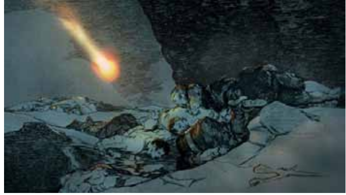
THE SAME (THING) ELSEWHERE 2010