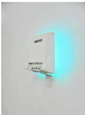
Solarium 2010 Lampe à UV