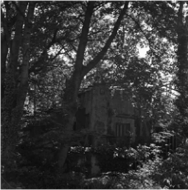
Pavillon du Maroc 1 2005 - 2006 photographie argentique, 50 X 50 cm extrait de la série Jardin Tropical