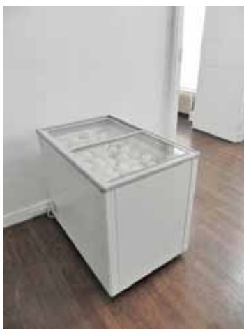
Cannibalisation d'une goutte d'eau 2010 Congélateur industriel et boules de neige