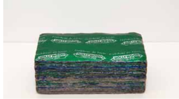
RUMINANT , 2006

www.bertrandgrimont.com/Linda_Sanchez-artist-45.html