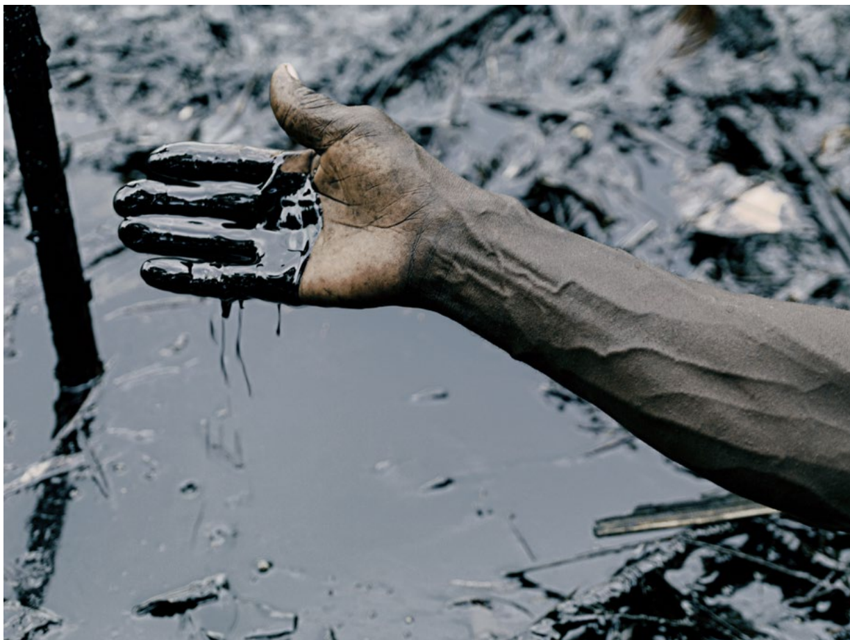
P. Chancel. Delta du Niger, Ogoniland, 2013

Neuf sites sont documentés à ce jour, de Port-au-Prince à Kaboul en passant par Fukushima, Barnaoul, Astana, l'Afrique du Sud, le Delta du Niger ou encore à plusieurs reprises en Corée du Nord. Philippe Chancel s'est rendu en début d'année à Dharavi en Inde et souhaite poursuivre et finaliser ce projet dans les deux prochaines années en visitant les quartiers Nord de Marseille, Nuuk au Groenland, la ville de Flint aux Etats-Unis ainsi que l'enclave espagnole de Mellila au Maroc. Chaque territoire fait l'objet d'un mode de présentation particulier qui tient compte des spécificités de chaque lieu et des problématiques rencontrées.