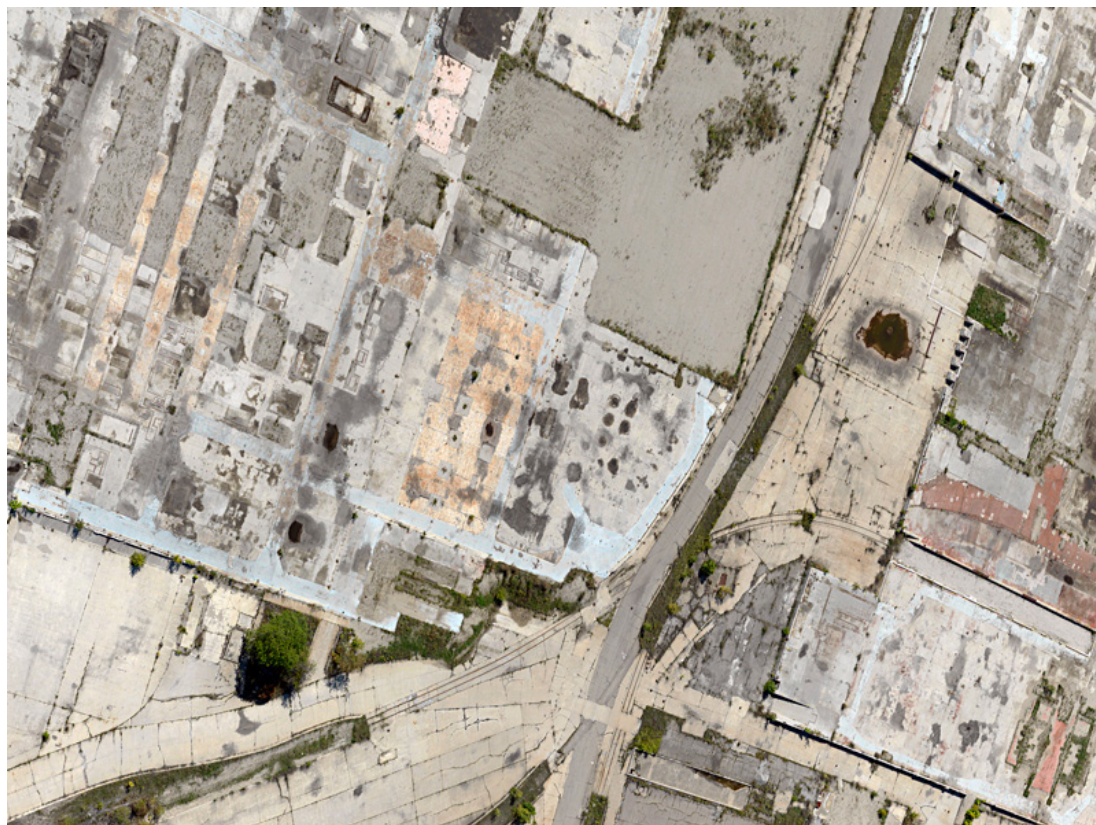
Philippe Chancel, Série « Drive Thru » (2015)

Exposition du 16 septembre au 15 octobre 2016 en lien avec la Quinzaine Photographique Nantaise