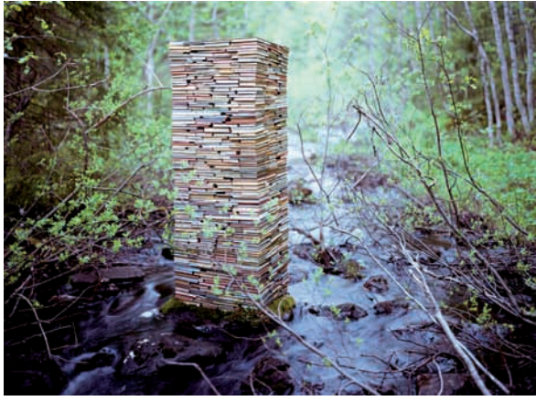
Second system of ethics, 2012 115x169cm c-print/aluminium/laminate